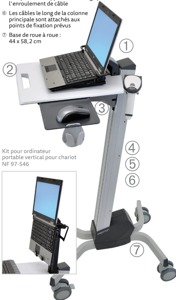
Kit pour ordinateur portable vertical pour chariot NF 97-546